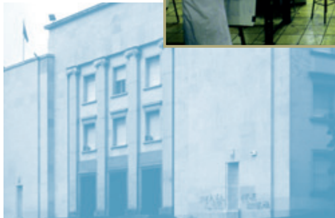
Escuela Técnica Superior de Arquitectura