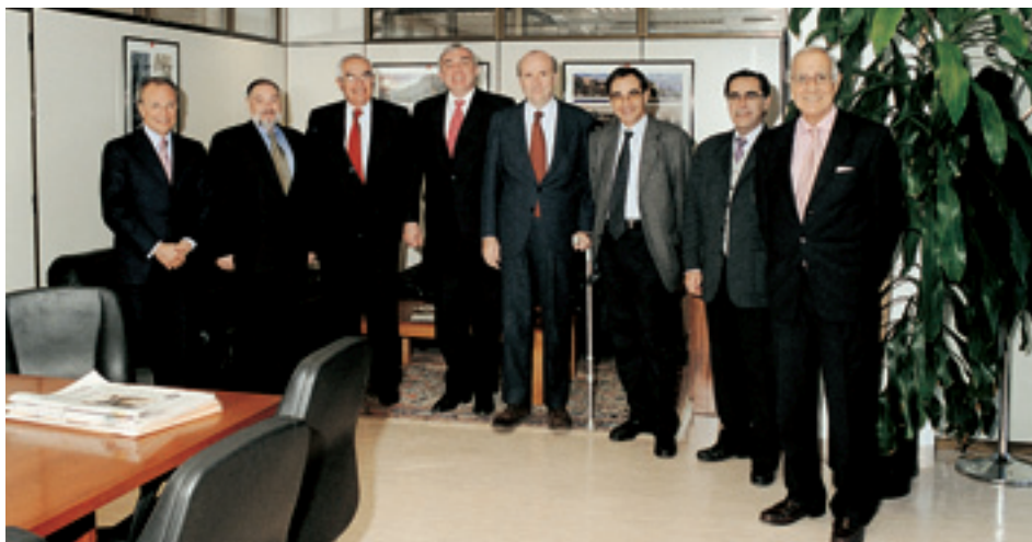
Acto de firma del Convenio por la creación del Foro de Encuentro y Debate Tecnológico UPM-Empresa.

Durante el año 2004, el Presidente del Consejo Social, y el Presidente de su Comisión de Servicios y Actividades, mantuvieron varias conversaciones con el Director General de Innovación Tecnológica de la Comunidad de Madrid con objeto de continuar el Foro de Encuentro y Debate Tecnológico Universidad Politécnica de Madrid-Empresa, iniciado en los dos años anteriores.