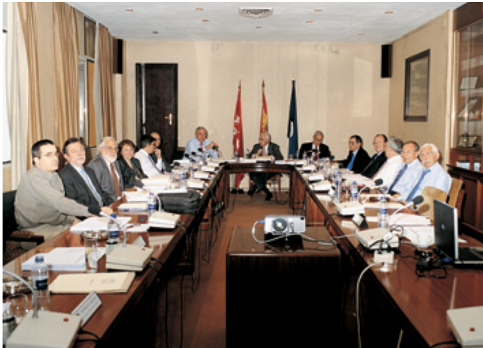
Sesión del Pleno del Consejo Social de la UPM.