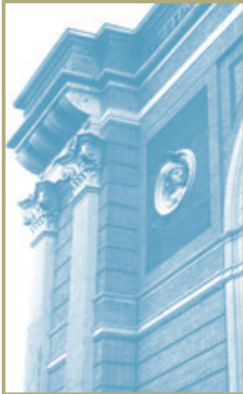
Escuela Técnica Superior de Ingenieros Industriales