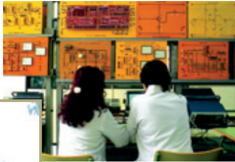
Escuela Técnica Superior de Ingenieros Aeronáuticos