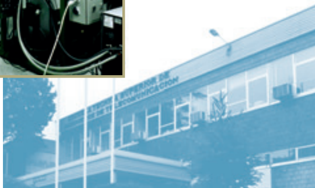
Escuela Técnica Superior de Ingenieros de Telecomunicación