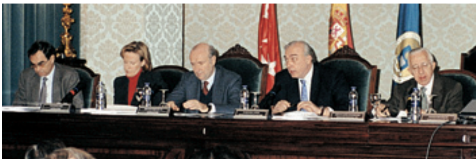
Acto de inauguración del Foro de Encuentro y Debate Tecnológico UPM-Empresa.

Madrid, que sirvan de apoyo al proceso de innovación tecnológica en el sector empresarial, en general y en particular en las PYMES, mediante la celebración de seis Jornadas o Encuentros sobre tecnologías o sectores industriales.