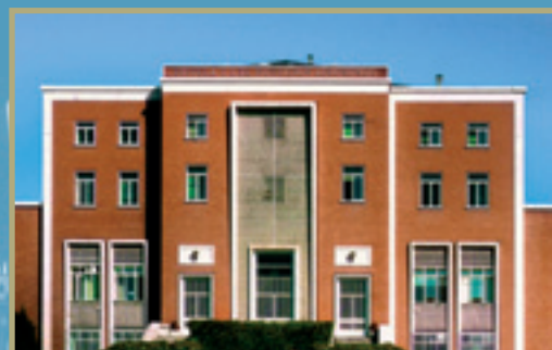
Escuela Técnica Superior de Ingenieros Agrónomos