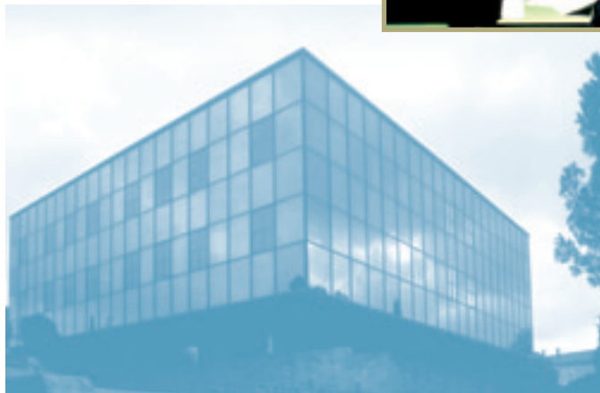
Facultad de Informática