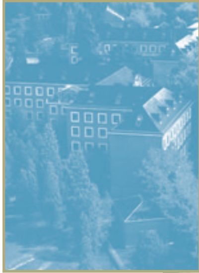
Escuela Técnica Superior de Ingenieros de Montes