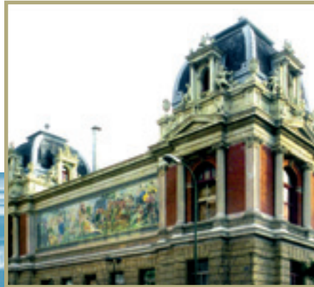
Escuela Técnica Superior de Ingenieros de Minas