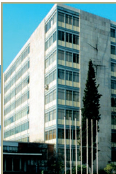
Facultad de Ciencias de Actividad Física y el Deporte