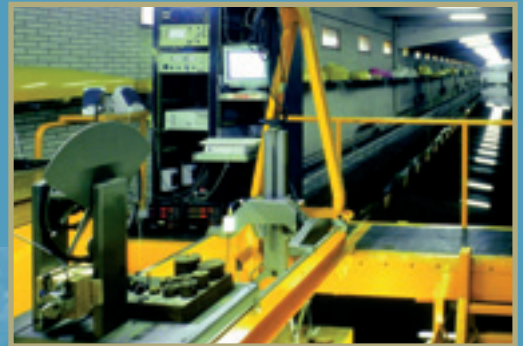
Escuela Técnica Superior de Ingenieros Navales